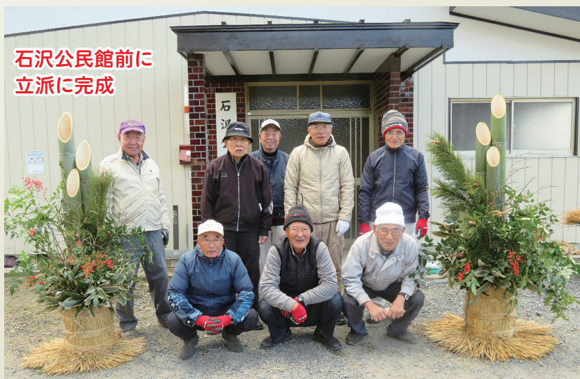
石沢公民館前に立派に完成